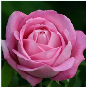
Mrs. John Laing