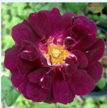
Nuits de Young

rosa - historisch, alba-rose 140-200 cm sehr stark, lang anhaltend duftende rose - duftbeschreibung nicht verfügbar James Booth