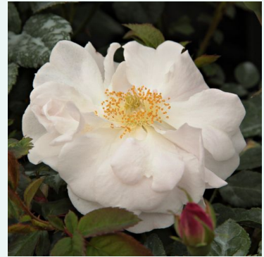
Félicité et Perpétue

hell-rosa - historische, centifolia-rose 140-220 cm stark duftende, gut wahrnehmbare rose - klassisch rosiger charakter Edward A. Bunyard