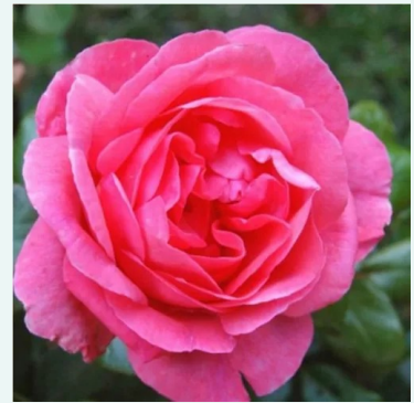
Frau Dr. Schrickler

hell-rosa - historische - alte gartenrose 120-190 cm mittelstarke, gut wahrnehmbare duftrose - mild süßlich Morlet