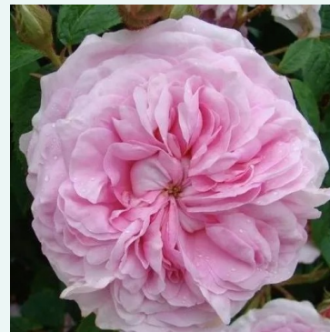
New Maiden Blush

rosa - historische, perpetual-hybrid-rose 110-160 cm sehr stark duftende, schon aus großer Entfernung wahrnehmbare rose - intensiv süß, teeartig, rosenhaft Henry Bennett