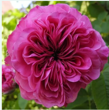
Duc de Cambridge

rosa - historische, teerose 100-140 cm mittelstark, gut wahrnehmbar duftende rose - teeartig, würzig William Edward Basil Archer